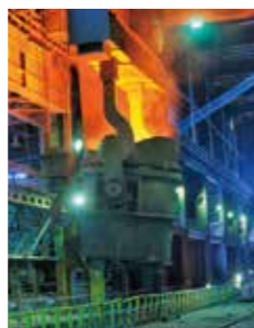
高温、粉塵の多い製鉄所、トンネル工事