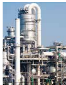
火気厳禁の化学系工場

電動式に比べ、火花や発熱のリスクが低く、火気厳禁工場（石油工場、薬品工場、塗装工場など）や、高温、多湿、粉塵の多い地下工事現場、トンネル工事現場など過酷な作業環境にも安心してお使いいただけます。