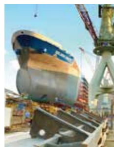
多湿、海沿いの造船所